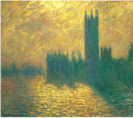
Monet, Houses of Parliament , 1904.