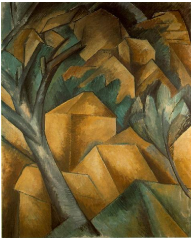
Georges Braque, Houses at Estaque, 1908, 73 x 60 cms. (Museo de Berna).

En 1911 expusieron como grupo en el Salon des Independants , el mismo año en el que Apollinaire consagró la denominación otorgando ya un carácter descriptivo al movimiento. Publicará en 1913 “Los pintores cubistas”, texto en el que se encuentra el conocido como “ manifiesto cubista ” (denominación no muy del gusto de los estudiosos).