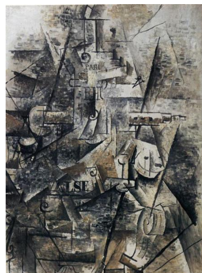
Georges Braque, Clarinet and Bottle of Rum on a

Otro rasgo estilístico del cubismo es la eliminación de la ilusión de la perspectiva . El estudio y descubrimiento de las leyes de la perspectiva fue un hallazgo decisivo en el Renacimiento. Saber hallar el punto de fuga, reducir los volúmenes con precisión según se alejan de nuestra posición, estudiar cómo los colores también cambian según la distancia, etc., fueron formas de saber representar en un plano el volumen, creando la ilusión de las tres dimensiones de una manera muy eficaz y más precisa que en épocas anteriores.