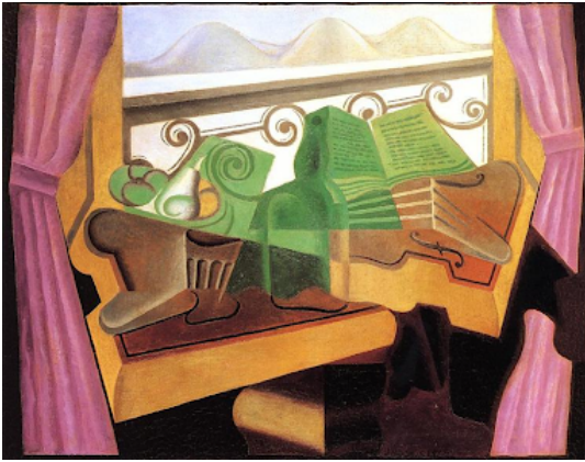
Juan Gris, Open Window with Hills , 1923 (73 x 92 cms.; col. privada).

La abstracción geométrica, la eliminación de la perspectiva, el uso del color que va del monocromatismo al estudio de las relaciones entre los colores que recuerda a los posteriores análisis de Kandinsky... Y, sobre todo, la deducción del asunto a partir del cuadro, de la arquitectónica, verdadera aportación del cubismo como estética a la historia del arte, reflejo de un espíritu de época.