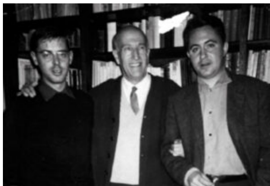
José Ángel Valente, Vicente Aleixandre (a quien está dedicado «Conjuros») y Claudio Rodríguez, 1967.

a realidades cotidianas, en principio, que tienen para él una significación especial, ya que su presencia ha configurado una experiencia densa de vida . Son cantos líricos que no se detienen en una descripción del objeto del canto, sino que analizan el significado de la experiencia vital.