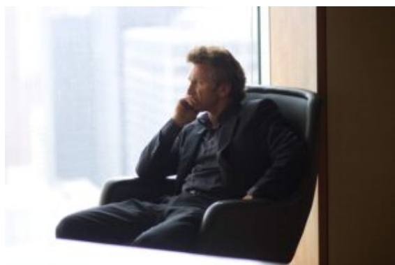
Sean Penn en «El árbol de

La peculiar estructura narrativa , que se acentuará en obras posteriores como To the wonder (2012), Knight of Cups (2015, comentada aquí ), o Song to song (2017, comentada aquí ), sigue la estética y planteamientos ya presentes en La delgada línea roja (1998, comentada aquí ). Se sale de lo convencional, por los saltos en el tiempo o por la inclusión de imágenes externas a la trama, aunque el argumento se puede seguir con facilidad. Por otro lado, la perspectiva claramente religiosa y reflexiva exige del espectador una forma de apertura, una actitud ante la película, que puede romper con muchas expectativas que tengamos en el visionado.