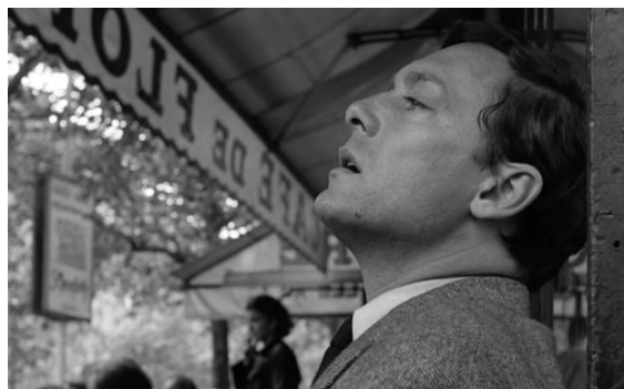
El fuego fatuo , Louis Malle

vaciamiento de la realidad. La realidad, la vida, se le ha escapado de las manos. Y en esa situación, se le revela la fatuidad de la vida su carácter ilusorio. Como dice la canción de Falla en El amor brujo :