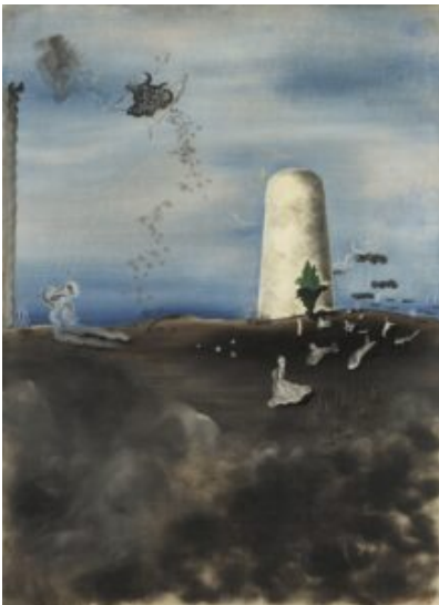
Yves Tanguy, La muerte acechando a su familia , 1927 (Thyssen)

Aquí fue mi intención tan solo poner en claro el odio hacia lo maravilloso y el deseo de ridiculizarlo que corroe a ciertos hombres. Terminemos de una vez: lo maravilloso es siempre bello, cualquier especie de maravilloso es bello, y no hay nada fuera de lo maravilloso que sea bello (Breton, Manifiesto 1924).