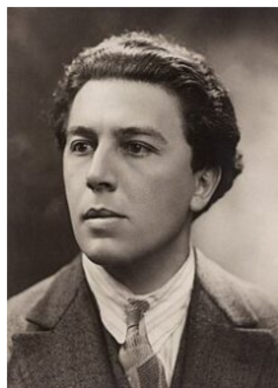
André Breton (fotografía de Henri Manuel, 1927)

Es posible que la imaginación esté a punto de reconquistar sus derechos (...) No ha de ser el miedo a la locura el que nos obligue a poner a media asta la bandera de la imaginación. Es indispensable instruir el proceso contra la actitud realista, que debe seguir al proceso contra la actitud materialista (Breton, Manifiesto 1924).