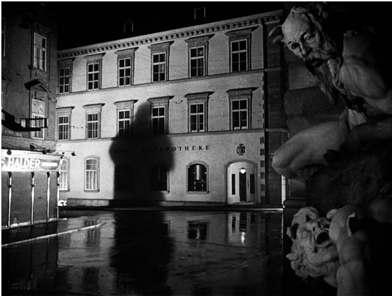
Fotograma de El tercer hombre (Carol Reed, 1945)

negro, cuando nosotros no vemos así, sin olvidarnos de la música de Anton Karas (puede verse/oírse aquí ), tan importante para dar el tono de la película, o el montaje y el uso del tiempo, son modos “no realistas” que usa el cine que se diferencian de la experiencia vital cotidiana.