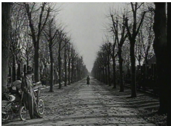
Alida Valli y Joseph Cotten en El tercer hombre (Carol Reed, 1949)

amante, con la nueva imagen que tienen. Es una lucha con un fuerte componente afectivo entre la lealtad del que ha amado, entre la admiración sentida, y el nuevo rostro.