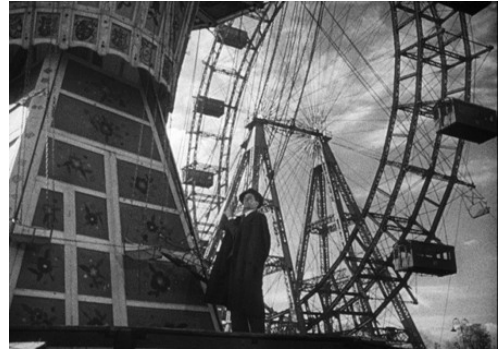
Fotograma de El tercer hombre (Carol Reed, 1949)

¿Víctimas? No seas melodramático. Mira ahí abajo ¿Sentirías compasión por alguno de esos puntitos negros si dejara de moverse? ¿Si te ofreciera 20.000 dólares por cada puntito, me dirías que me guardara mi dinero o empezaría a calcular cuántos serías capaz de parar? Libre de impuestos, amigo. La única manera de ahorrar hoy en día.