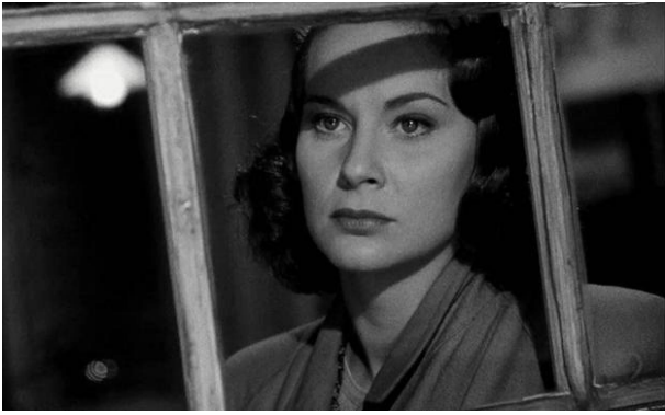
Alida Valli como Anna Schmidt en El tercer hombre (Carol Reed, 1949)

El filósofo alemán Robert Spaemann explicó con claridad y profundidad que la percepción del ser personal del otro es el fundamento de la ética. Pero para captar este carácter personal, la percepción debe ser benevolente, una percepción abierta, liberada de la centralidad del yo. No es esta una cuestión de racionalidad teórica. Percibir la realidad personal del otro es no subsumir la realidad del otro en una categoría racional, abstracta, sino dejar que la persona se manifieste en su concreción. Asistir a esa manifestación exige una mirada amorosa. Percibimos la realidad personal con claridad de aquellas personas a las que queremos, donde el respeto está en la base. Pero si tipificamos a las personas y las incluimos en categorías (extranjeros, pobres...) abstraemos parte de su realidad y nos quedamos con algo común. Las categorías sirven para pensar, pero eclipsan la realidad que debería imponerse a nuestra tendencia a crear tipos, a clasificar, a numerar. Holly Martins percibe el carácter personal del niño cuando este sufre.