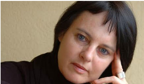
Chantal Maillard

Chantal Maillard expresa la experiencia del cansancio persistente. El dolor continuado al que alude la autora a lo largo de sus poemas se condensa aquí en este estado que colorea la vida del yo poético. Es el dolor causa directa de este cansancio, de esta fatiga física y emocional que nunca desaparece del todo.