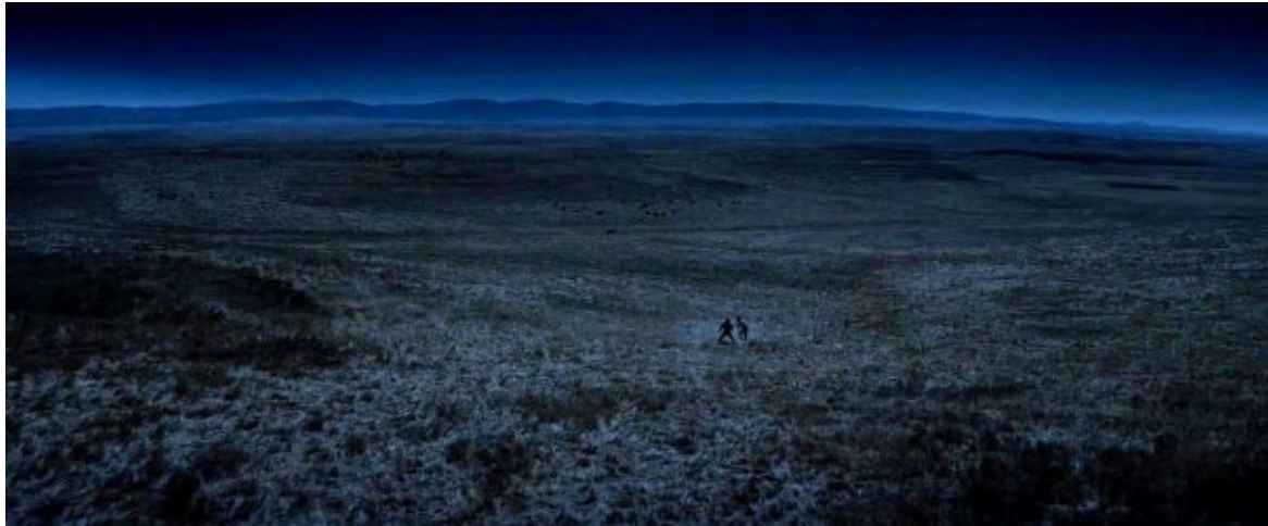
Fotograma de la secuencia en la que pelean James McKey y Steve Leech, Horizontes de grandeza (W. Wyler, 1958)

Hay algo de primitivismo en esta forma de vida del “Oeste” que “descubre” y va haciendo suya una nueva tierra que muestra por sí misma un carácter edénico por su belleza y por la poca presencia de la huella humana. A pesar de que sus nuevos moradores llevarán consigo la civilización de la que provienen, la marca de ser un nuevo comienzo está muy subrayada en este género.