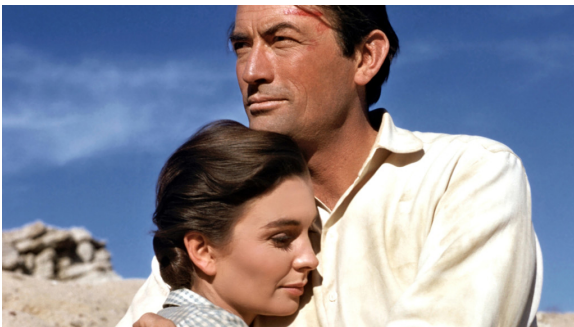
Jean Simmons y Gregory Peck en Horizontes de grandeza (W. Wyler, 1958)

Una de las constantes del género western es la violencia. Hay violencia en el sentido básico de lucha por la vida, de agresividad. Habitar un espacio tan enorme que a veces se muestra como hostil exige un esfuerzo y lucha constantes para poder sobrevivir. Eso es así en todas partes; forma parte de la condición humana en su relación con la naturaleza.