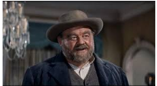
Burl Ives como Rufus Hannassey. Fotograma de Horizontes de grandeza (W. Wyler, 1958)

noble, muchas veces con dificultad. Por eso, las películas clásicas del oeste dan muchas veces la sensación de que hay “buenos y malos”.