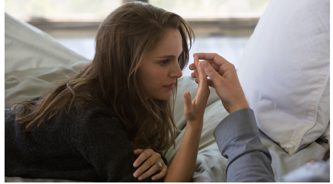
Natalie Portman en Knight of Cups , Mallick, 2015

Una frase de contenido fuerte. No quiere poner en cuestión si amar a un hombre que no es su marido es correcto o no. Es tan importante el amor, y tan infrecuente, que hay que cogerlo. Esto revela un poso de tristeza. El amor es lo importante, es la clave del sentido. En su siguiente película, Song to song, Mallick nos cuenta el anhelo del amor que define la vida de la protagonista. El amor es el motor de la vida . De hecho el caballero de copas, carta del tarot, simboliza el romanticismo, la promesa del amor.