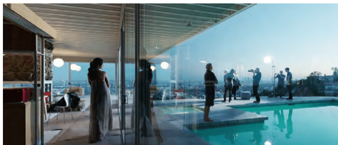
Escena de Knight of Cups , Mallick, 2015

El hilo argumental fundamental de la película es el que sigue las sucesivas relaciones y encuentros que mantiene el protagonista con diferentes mujeres. Con estas historias que apuntan a diferentes actitudes vitales se va forjando un retrato del protagonista. Aunque no queda del todo claro el orden cronológico, parece hacer referencia a la última etapa de la vida.