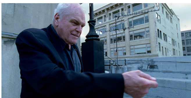
Brian Dennehy en Knight of Cups , Mallick, 2015

Son duras estas palabras. Hablan de una decepción, de una gran frustración . La esperanza en hallar sentido que se esperaba encontrar con el paso de los años, no se cumple. En la película se constata esta situación, no se explica el proceso vital del padre al que ya vemos mayor.