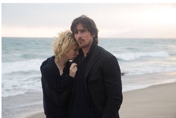
Cate Blanchett y Christian Bale en Knight of Cups , Mallick, 2015

El estilo de Mallick, que gusta y disgusta con intensidad a unos y a otros, es muy radical en sus formas. El montaje con saltos bruscos, una historia no lineal, la belleza plástica de las imágenes (otra vez con Emmanuel Lubezki como director de fotografía), el uso de la voz en off de tono pausado, reflexivo, sereno, el acompañamiento de la música que forma un todo con las imágenes de tono lírico... Estos rasgos estilísticos hacen de la película una propuesta no habitual y dotada de mucha fuerza.