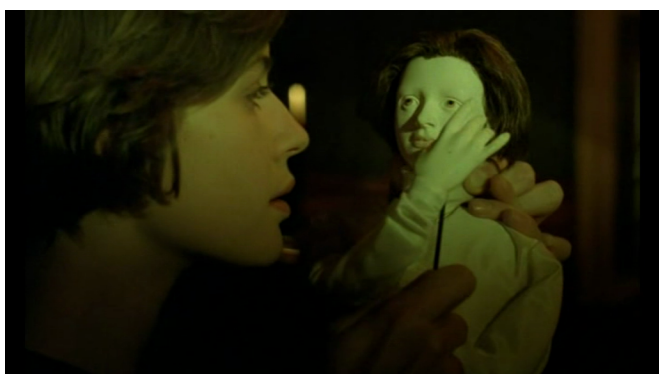
Irène Jacob en La doble vida de Verónica

Una línea argumental importante en la película es la presencia de las marionetas y del titiritero. Esta es otra duplicidad. Desde siempre la humanidad ha duplicado su mundo al crear objetos con los cuales, a través de la imaginación, ha contado historias. Los muñecos son de todo tipo y ya desde niños jugamos inventando historias donde los muñecos son personajes. Más adelante esta actividad se puede perfeccionar y aparece el teatro de títeres. Al duplicar este mundo (el mismo cine lo hace) se construye un marco con una trama con la que explorar la identidad humana, sus motivaciones, sus preocupaciones fundamentales.