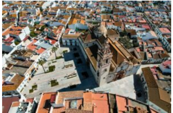
Iglesia de Moguer ( aquí )

funcionales. Ella misma tiene una estructura de orientación simbólica en la que ciertos lugares actúan como centros de significado que configuran la identidad, la memoria. Estas referencias son ingredientes fundamentales de la experiencia del habitar.