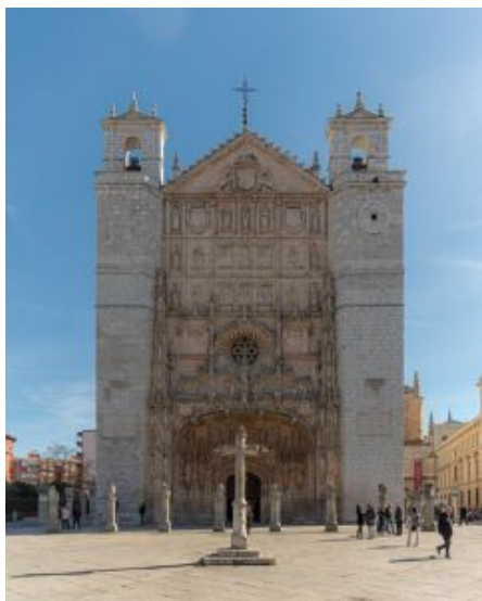
Iglesia de San Pablo en Valladolid (España)

Familia de Barcelona (Nacimiento, Pasión y Gloria) son el ejemplo actual más llamativo al respecto.