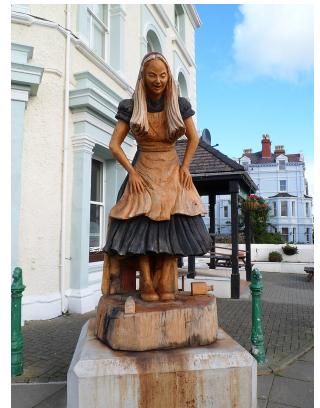
Estatua de Alicia en Llandudno, localidad de Gales vinculada a la biografía del autor