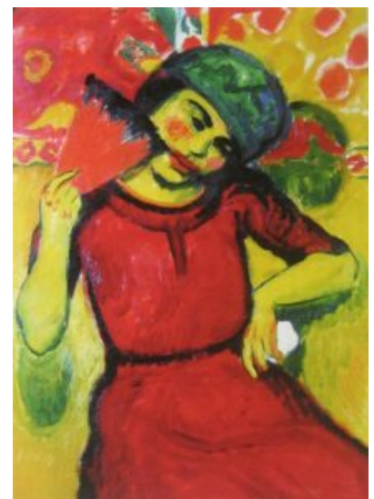
Pechstein, Mujer joven con abanico rojo (1910)

En los catálogos citados, la profesora Moeller destaca como propio del grupo Die Brücke el ideal de unir arte y vida. Buscan nuevas formas artísticas que tengan una fuerte dimensión vitalista . En el programa escrito, grabado en madera por Kirchner y publicado como hoja volante en 1906, se dice: