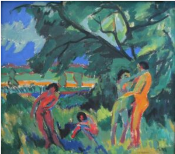
Kirchner, Playing Naked People, 1910

Tuvieron la oportunidad de estudiar el desnudo -base de todo arte visual- en su libertad natural. Del dibujar de ese modo nació el deseo, común a todos ellos, de inspirarse en la vida misma y de someterse a la experiencia directa (Kirchner, Crónica del "Brücke", 1916).