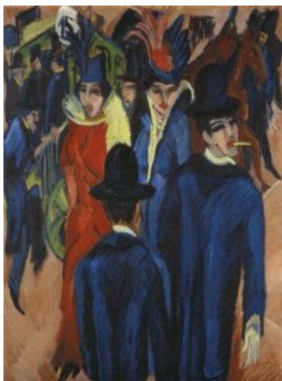
L. Kirchner, Escena de calle en Berlín (1913-1914)

Una variante de la naturalidad buscada es el aprecio que tuvieron por el llamado “arte primitivo” del Pacífico y África que conocieron en los museos etnográficos, en torno a 1910. Esto recuerda, otra vez, a Gauguin, a ese ideal que interpreta lo primitivo como algo auténtico, más natural, alejado de un