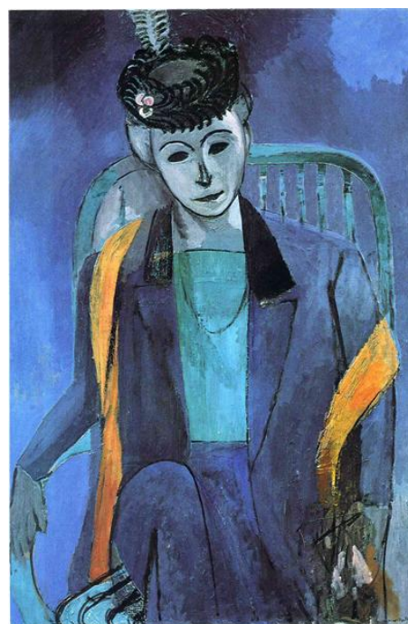
Matisse, Portrait of Mme. Matisse , 1913,

La subjetividad del pintor juega un papel activo en la expresión del tema. Podemos vislumbrar algunas facetas de esta actividad .