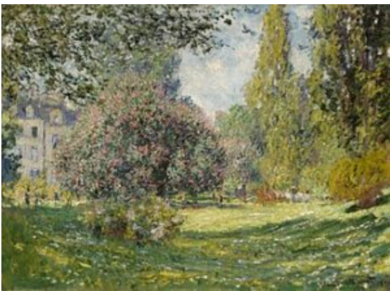
Monet, Paisaje, el parque Monceau , 1876

“Tiempo en profundidad” que se posa, que es “tuyo en su interior”. Forma parte de la experiencia de la habitabilidad de los lugares la vivencia de la temporalidad. La mera sucesión del tránsito propio del tiempo como Cronos se diferencia del tiempo como duración y permanencia que caracteriza el Kairós (sobre espacio vivido y ritmo, aquí ). El tiempo vivido en los parques, cuando se disfruta en ellos, se acerca al segundo modo, ya que la atención está puesta en el estar, en la vivencia plena del presente , que se aleja de la forma de vivir el tiempo como anticipación, cuando solo queremos llegar a un sitio, cuando buscamos un resultado; así como también se opone al permanecer en el pasado del que no se puede salir, como en aquellas experiencias de un pasado doloroso que vuelve y que cierra un futuro ( tiempo cerrado/tiempo abierto del que hablaba Marcel).