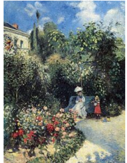
Pissarro, El jardín en Pontoise, 1877