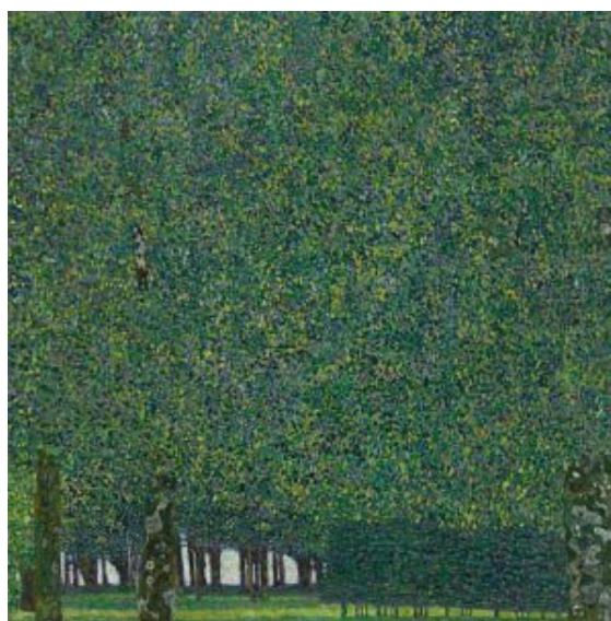
Klimt, Parque , 1909 (MoMA)

En los parques aparecerán estos elementos básicos :