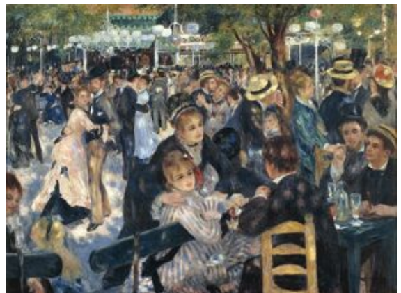
Renoir, Bal du moulin de la galette , 1876 (Musée d'Orsay)