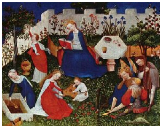
Maestro del Alto Rin, La Virgen en el Jardín del Paraíso con los santos , c. 1410

Esta conciencia de la naturaleza como paisaje nos habla de un tipo de mirada estética y contemplativa, no utilitaria. La belleza de la naturaleza es considerada como fin en sí misma, como algo congruente con la subjetividad humana, con el deseo de belleza .