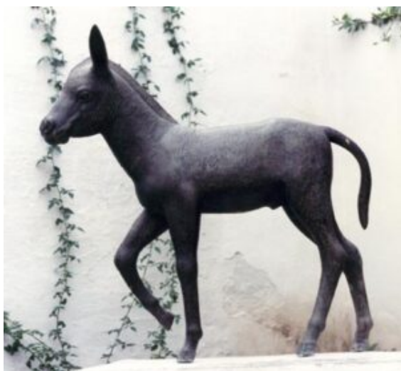
Estatua de Platero en Casa Museo J.R.J. de Moguer.

la primavera os asustará, enmascarada de invierno.