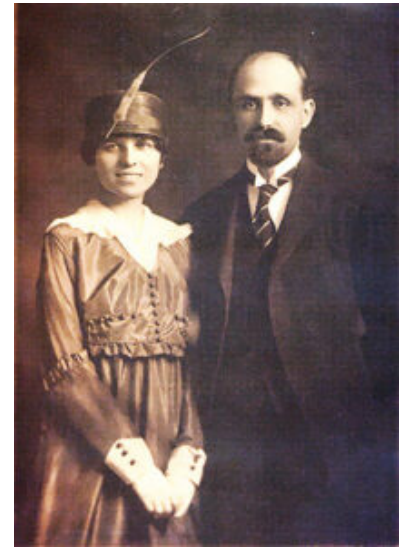
Retrato de boda de Juan Ramón Jiménez y Zenobia Camprubí (2 de marzo de 1916, Nueva York).