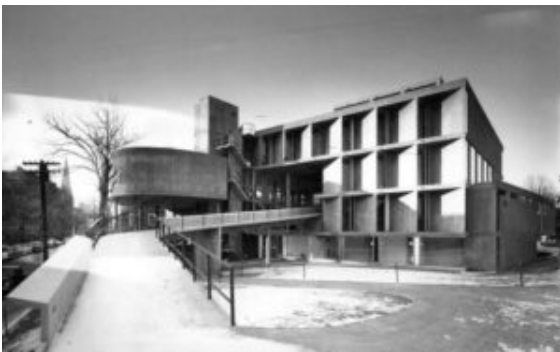
Le Corbusier, Carpenter Center for Visual Arts , Cambridge, FLC-ADAGP

El sentido de la marcha y el de la vista determinan el delante y el detrás. Así como hay muchas cosas que están pensadas para diestros, lo que dificulta a los zurdos algunos usos de cosas, dado que en una calle se puede ir andando en los dos sentidos, las coordenadas delante/detrás no parecen tan determinantes en principio. Otra cosa ocurre con la circulación de vehículos. Los sentidos de la marcha, la prohibición y la prescripción del sentido del giro, sí que son importantes.