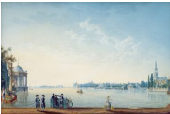
Anton Ignaz Melling, La Ciudad de Zwolle en las orillas del Ijssel en Holanda, 1814

Las ventanas, junto con las puertas, son la forma de abrir al exterior las viviendas. Las avenidas anchas y abiertas frente a los recovecos de muchas callejuelas de la parte vieja de las ciudades. La situación de la ciudad en un alto o en una hondonada... Las variaciones son numerosas.