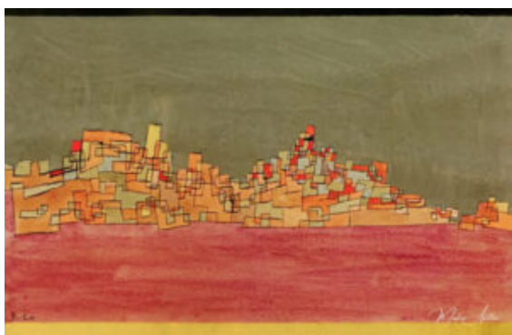
Paul Klee, Ciudad de dos colinas , 1927

La cercanía y lejanía mencionada la vivimos, sobre todo, en sentido horizontal. Las otras coordenadas básicas tienen que ver con la verticalidad a las que también podemos aplicar las características de cercanía y lejanía: lo bajo está a la mano , como mucho, en el suelo que pisamos, mientras que lo alto puede ser inalcanzable.