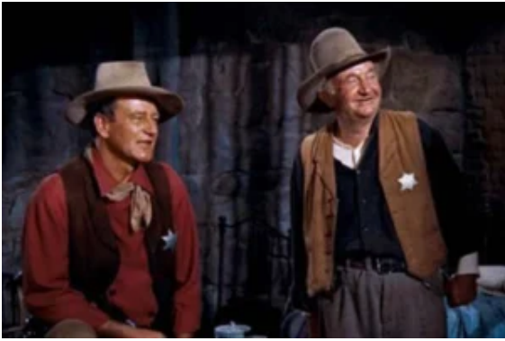
John Wayne y Walter Brennan en «Río Bravo»

Como he mencionado, a Howard Hawks (parece que tampoco a John Wayne) no le gustaba el personaje del sheriff de Solo ante el peligro ya que expresa miedo y debilidad. Solo una breve reflexión: la ausencia de miedo en situaciones de peligro en los que la conciencia dicta realizar un bien que se presenta como difícil no es un ideal moral. El ideal moral es la valentía , el afrontar la dificultad y el miedo ante el bien por hacer, cosa que hace el sheriff en Solo ante el peligro . Lo que sí plantean estas dos películas, en mi opinión, es otro tema: si el cumplimiento de ese deber es temerario . Como es sabido, Aristóteles caracterizó la virtud como un medio excelente entre dos extremos, defecto y exceso del justo medio. El famoso y claro ejemplo de la valentía nombra el defecto (la carencia, la pobreza) como cobardía, y el exceso como temeridad. El comportamiento temerario, que puede ser aparentemente valiente, es malo en sentido moral según Aristóteles porque se afronta un peligro mayor del que se puede encarar, poniendo en serio peligro otros bienes que deben ser custodiados.