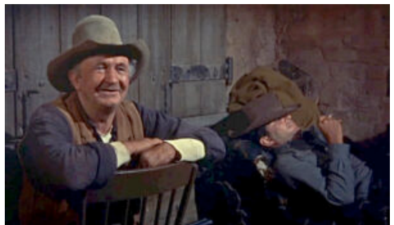
Walter Brennan y Dean Martin en «Río Bravo»

Con toda esta violencia aparecen dos figuras conocidas: la del sheriff , que tiene que mantener la paz y, unido a él, el juez, que condensa en su figura la importancia de la ley. Hacerla cumplir es difícil, más en lugares alejados, como es el caso de esta película. En otras películas aparece como tema central la relación entre estas dos figuras y las dificultades señaladas: Camino de la horca (R. Walsh, 1951; reflexión aquí ) o El hombre que mató a Liberty Valance (J. Ford, 1962; reflexión aquí ), son excelentes ejemplos.