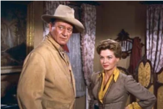
John Wayne y Angie Dickinson en «Río Bravo»

En el planteamiento inicial de ambas obras, la diferencia es nítida. En Solo ante el peligro , el sheriff pide ayuda y no la encuentra porque los conciudadanos tienen miedo o no quieren contrariar al poderoso. En Río Bravo , este otro sheriff no acepta la ayuda que los demás quieren prestarle porque eso pone en peligro sus vidas, algo que le resulta inaceptable.