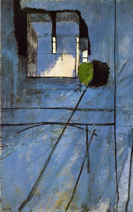
Notre- Dame Matisse, 1914 MoMa

Que sea posible una pintura no figurativa se debe a que lo visible, lo que vemos, en sentido estricto, es algo sencillo: vemos colores, manchas de colores, que ocupan un área, un espacio normalmente delimitado; vemos figuras y colores. En la vida ordinaria no decimos esto ya que decimos que vemos un coche, una montaña... Pero eso lo hacemos porque sabemos la apariencia que tiene una montaña, porque sabemos lo que es una montaña y la reconocemos en la vida real. Cuando vemos algo que no sabemos lo que es, a veces algo que no reconocemos por la perspectiva o la distancia, experimentamos que vemos pero que no reconocemos lo que vemos. Y con eso trabaja la pintura no figurativa, con figuras y colores, elementos básicos de lo visible que, en principio, no representan nada reconocible.