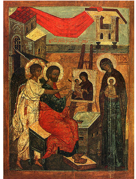
Icono ruso del siglo XVI, que reproduce la Virgen de Vladimir.

El que haya un código, por lo tanto, es algo constitutivo de la creación de imágenes pictóricas. Ese código atraviesa la composición y factura de un cuadro. Por lo tanto, en la pintura figurativa tenemos varios elementos esenciales de la significación.