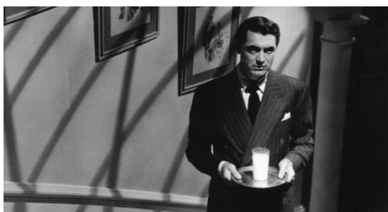
Cary Grant en Sospecha (1941) de Alfred Hitchcock

En la confianza vivimos un abandono, un dejar hacer. Si confiamos en una persona, tenemos la certidumbre de que su hacer nos beneficiará o de que no nos dañará, de que obrará con acierto. No podemos controlarlo todo y en la confianza nos dejamos aconsejar, guiar. Pero en la sospecha se generan actitudes opuestas. No podemos dejar hacer, no nos podemos abandonar . Al contrario: como decíamos, se impone una actitud de vigilancia, y no queremos que nos hagan ningún favor. Si sospechamos, en sentido fuerte, estamos sospechando de las malas intenciones y creemos que su acción nos perjudicará, lo contrario a lo que vivimos en la confianza.