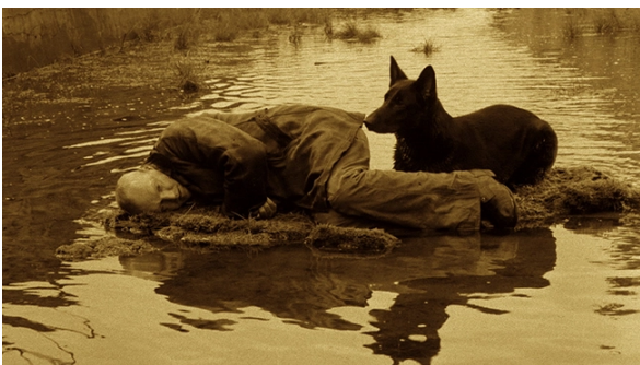
Fotograma de Stalker (Tarkovski, 1979)

En mi opinión, no supone otra cosa que un intento de volver a encontrar el propio yo, de conseguir una nueva fe.