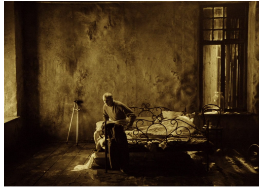
El stalker, al comienzo de la historia. Stalker (Tarkovski, 1979)

Ser un stalker es una vocación , algo que el protagonista no puede dejar de ser y hacer, a pesar de las dificultades que conlleva, si no quiere traicionarse a sí mismo. Qué fuerte tiene que ser esa llamada para dejar a su familia, tremendamente frágil, en condiciones precarias y con la incertidumbre sobre si volverá. Es algo que hace de manera repetida, lo que explica el grito desesperado de su mujer cuando se va su marido en la primera escena. Al final, en un monólogo iluminador, su mujer nos dirá que es un hombre "simplón". Ciertamente, así lo parece al principio, pero su determinación es clara. Su misión es guiar a las personas que quieran por una ruta muy difícil. Él no quiere beneficiarse de lo que ofrece la habitación, solo llevarlos a ese sitio especial.