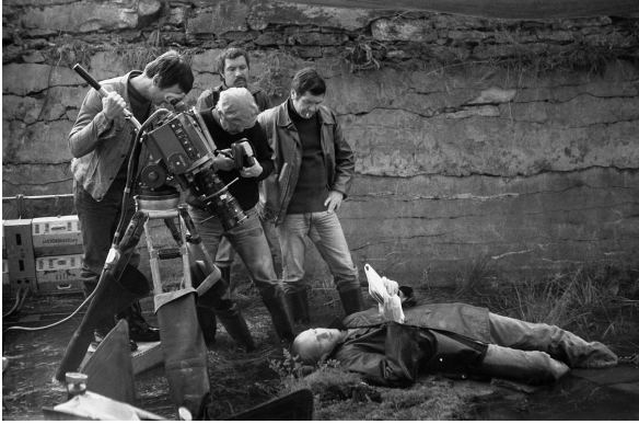
Fotografía de rodaje de Stalker (Tarkovski, 1979)

La visión humanista de Tarkovski es también una visión realista. Su juicio sobre el modo de vida moderno es muy negativo porque configura una manera de ser en las personas con la que olvidan su verdadera naturaleza. El «hambre sensorial» domina y empobrece las posibilidades vitales, convierte al ser humano en un ser solipsista incapaz de dar y, por lo tanto, incapaz de fe. En Nostalgia (comentada aquí ), película de 1983, profundizará en esta problemática.