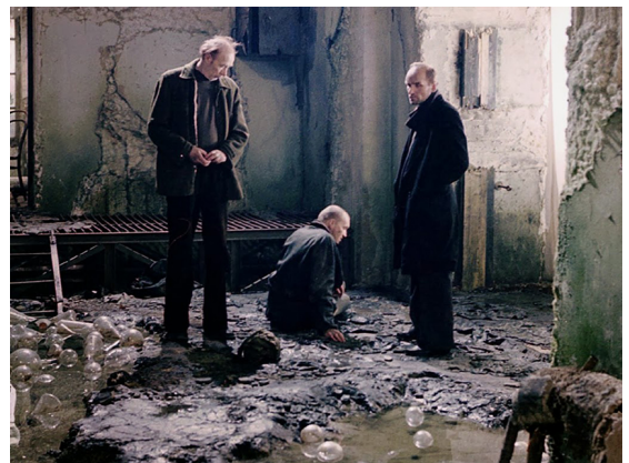
El Profesor, el Stalker y el Escritor, en Stalker (Tarkovski, 1979)

que les obligan a tomar postura , a replantearse problemáticas importantes. Lo fantástico es un pretexto, pero funciona muy bien para plantear las cuestiones básicas que le interesan. ¿Cuáles son los deseos más profundos del ser humano?, ¿sabemos lo que deseamos, lo que en el fondo queremos? La pregunta no está formulada en términos universales como cuando se afirma que todo ser humano quiere ser feliz, por ejemplo. La pregunta hace referencia a lo que cada uno de nosotros desea desde lo más recóndito de su corazón.