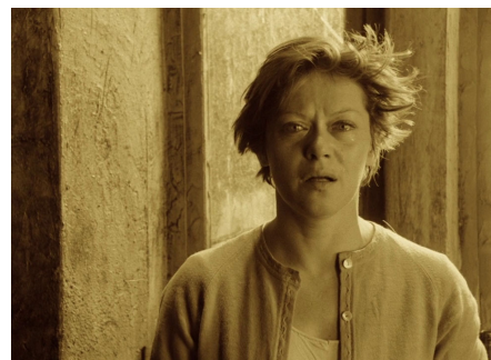
Alisa Freindlich en Stalker (Tarkovski, 1979)

Seguro que ustedes ya comprendieron que él es un simplón. Todos los vecinos se reían de él. Era un lelo, daba lástima. Mi mamá decía: «¡Él es un Stalker, un suicida, siempre está preso! ¡Piensa en cómo son los hijos de los stalkeros». Y yo, ni siquiera discutía. Yo sabía que eso era así, que es un suicida, siempre está encarcelado. Y el problema de los