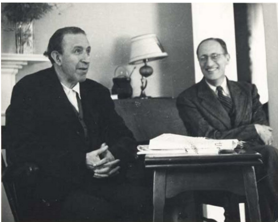
Pedro Salinas y Jorge Guillén

Jugar en un ámbito de confianza es divertido. En el escondite no se sabe dónde están los demás; queremos y no queremos saberlo. Queremos descubrirlo: es el placer del hallazgo. Ciertamente, en el escondite se trata de buscar, en eso consiste el juego. Con lo cual, esta imagen solo sirve para explicar el placer del juego confiado, el placer y la alegría del hallazgo.